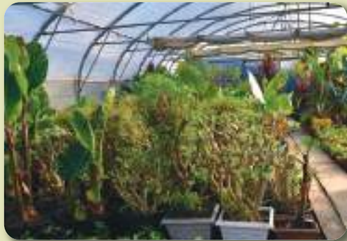
La serre municipale en période d'hivers

Si tout au long des rues de la ville chacun peut être charmé par la multitude de couleurs chatoyantes qui s'offrent à notre regard, c'est en grande partie grâce au travail des agents du service fleurissement. Tout au long de l'année, ils gèrent ou préparent les milliers de plantations et arbustes qui décorent la ville. Sachons respecter la qualité de leur travail en laissant les plantations en place !