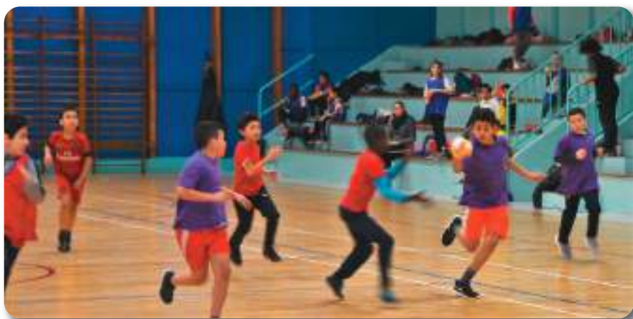
Des matches engagés !