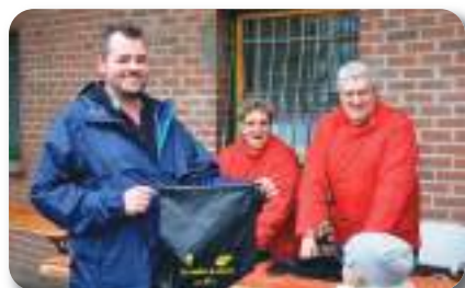
Chaque coureur a reçu un sac