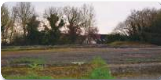
A la place de l'édifice, un espace libre. Pour combien de temps ?