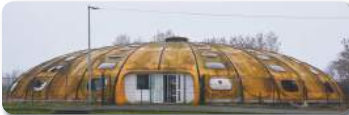
La piscine telle qu'on la connaissait.

Inaugurée en novembre 1978 mais fermée depuis trois ans, la piscine Tournesol est maintenant démolie. Cette décision aura fait un peu mal au cœur de louvroiliens attachés à « leur piscine ». Cependant, elle est rendue nécessaire à la fois par l'état dans lequel se trouvait cet équipement, mais aussi par les projets portés par la municipalité à cet endroit.