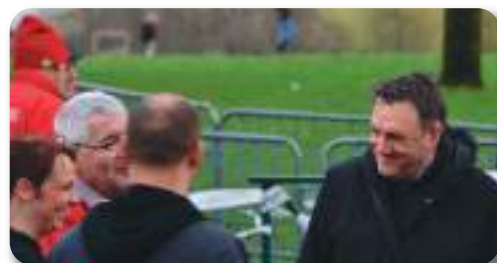
Monsieur le Maire