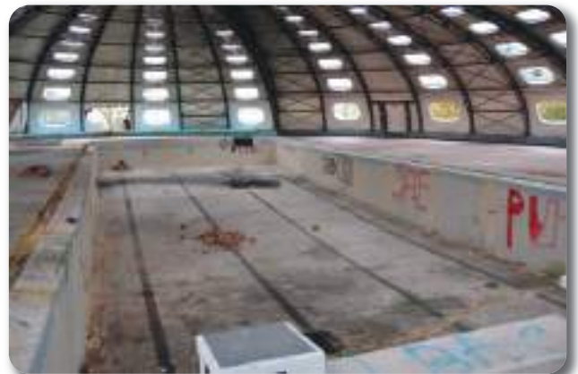
Le bassin juste avant la démolition.