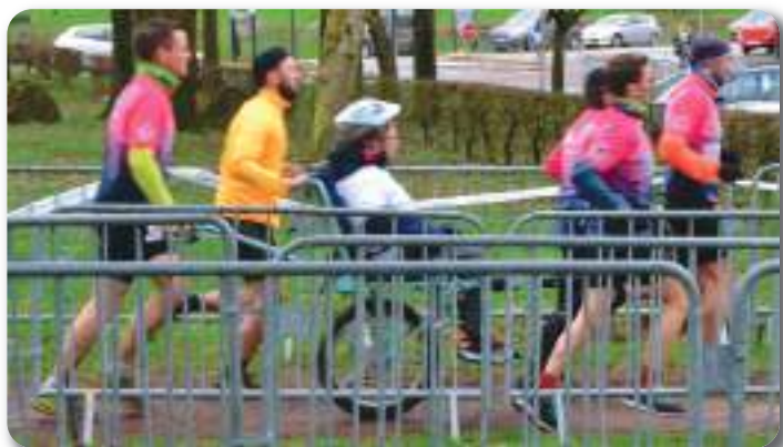
Une des 5 joëlettes présentes sur le parcours