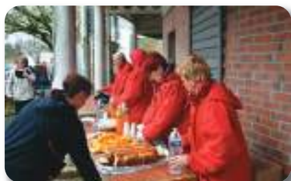
Des bénévoles toujours au service !