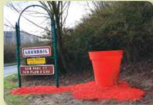
Une vue des bacs installés aux entrées de la ville